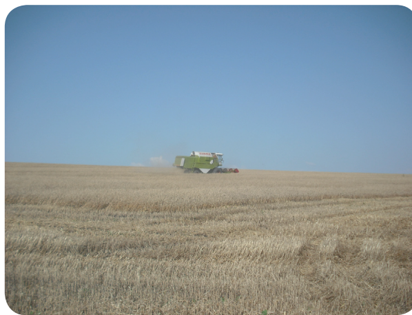
Juli 2010, Skörden i full gång på ett av Bolagets markområden.

Black Earth East investerar i jordbruksmark av hög klass. Chernozem, den så kallade svartjorden, är enligt agronomer en av de mest eftertraktade jordtyperna i världen. (ISRIC, World Soil Information)